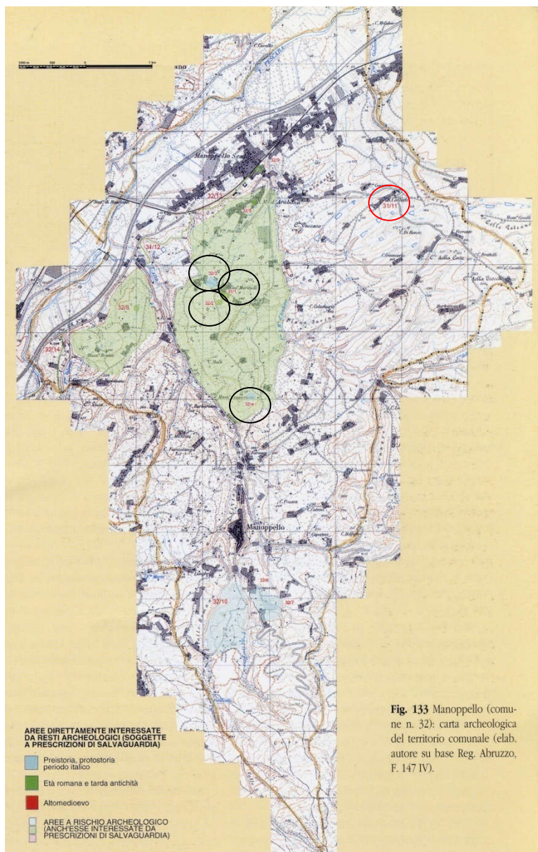
Fig. 133 Manoppello (comune n. 32): carta archeologica del territorio comunale (elab. autore su base Reg. Abruzzo, F. 147 IV).

La zona maggiormente interessata dalla presenza di resti archeologici è situata nell'area di