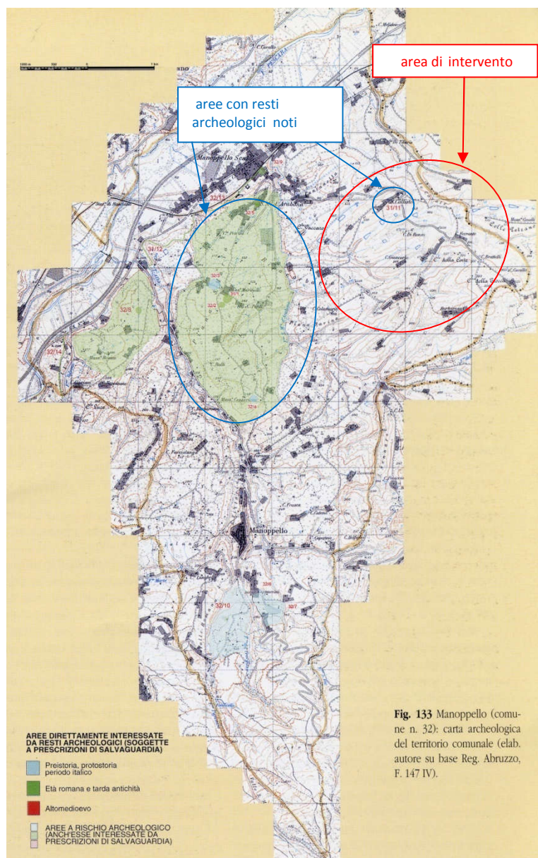
Fig. 133 Manoppello (comune n. 32): carta archeologica del territorio comunale (elab. autore su base Reg. Abruzzo, F. 147 IV).

Per le considerazioni sopra esposte risulta medio il rischio archeologico.